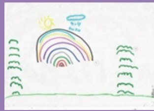
MUJER 8 AÑOS REPRESIÓN INHIBICIÓN