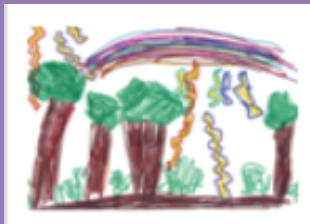
VARÓN 11 AÑOS AGRESIVIDAD