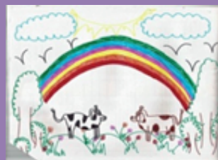
MUJER 10 AÑOS SUBLIMACIÓN CREATIVA