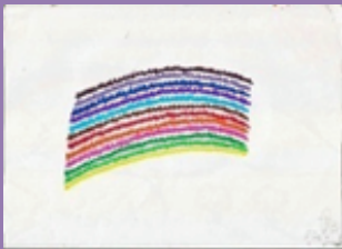
VARÓN 22 AÑOS AISLAMIENTO